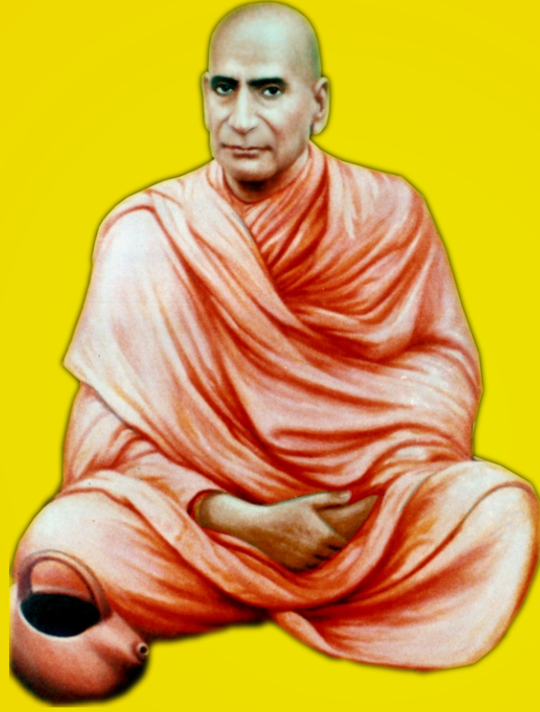
स्वामी श्रद्धानन्द जी Swami Shradhdhanand Ji ( 1856-1926 )